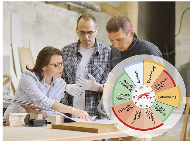
Abbildung 3: OERTLI_Projektbegleitung.jpg "Projektbegleitung durch OERTLI Experten"