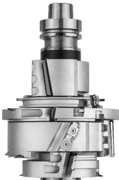
Abbildung 2: Fensterwerkzeug CAT_fg.png "Fensterwerkzeug mit CAT Schneidensitz"