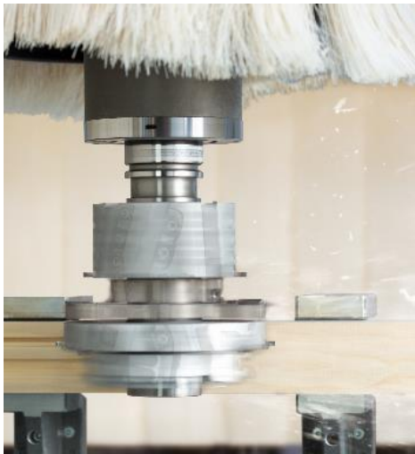
Abbildung 1: OE_Folder_CAT_DE_A4_ATp-2.png "CAT Fensterwerkzeug im Einsatz"